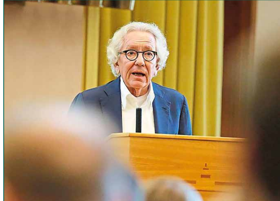
Dr. Stephan Holthoff-Pförtner, Minister für Bundes- und Europaangelegenheiten sowie Internationales des Landes Nordrhein-Westfalen, zeigte sich während seiner Rede bei der Konferenz „Erste Wahl: Europa!“ besorgt über die zunehmende Europaskepsis.

Neben den Sorgen gab es also auch Zuversicht. „Wir müssen die jungen Leute begeistern, wählen zu gehen“, sagte etwa Holthoff-Pförtner mit Blick auf die Europa-Wahlen am 23. bis 26. Mai.