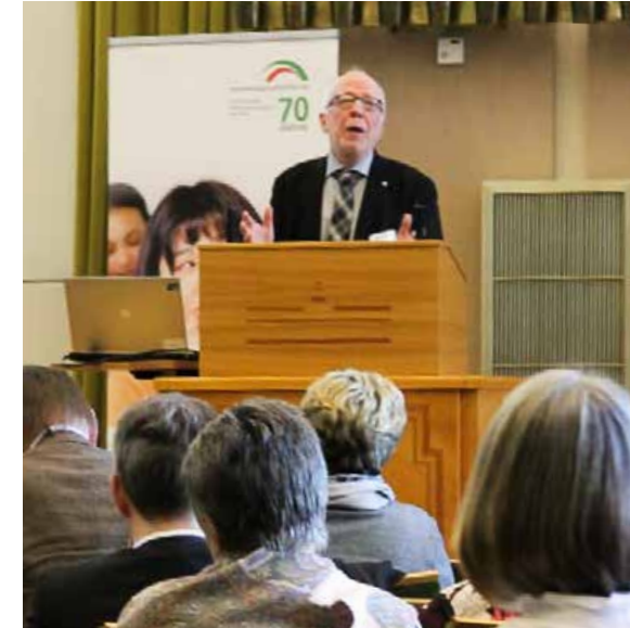
Staatsminister a.D. Wolfram Kuschke, Vorsitzender des Kuratoriums der Auslandsgesellschaft.de e.V.

2.) Die seit 2013 erfolgende Auszeichnung als „Europaktive Kommune in Nordrhein-Westfalen“ hat sich als erfolgreiches Instrument erwiesen, zivilgesellschaftliche Prozesse in der Stadtgesellschaft zu initiieren, zu verstärken und in kontinuierliche und nachhaltige Strukturen zu überführen.